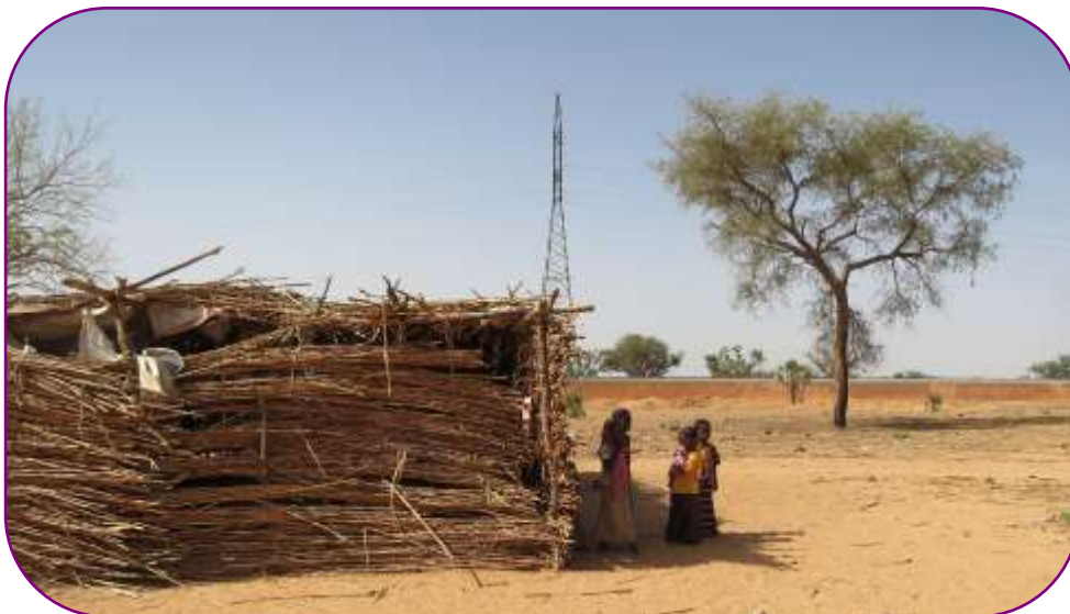
Les événements de l'année 2015 ont un impact négatif direct et indirect sur la vie et le développement des enfants

Sur le plan sécuritaire , les attaques perpétrées par la secte