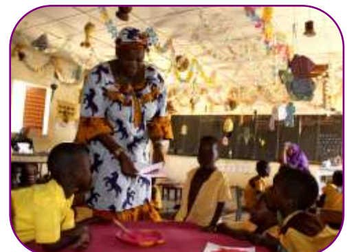
Des activités ludiques sont organisées