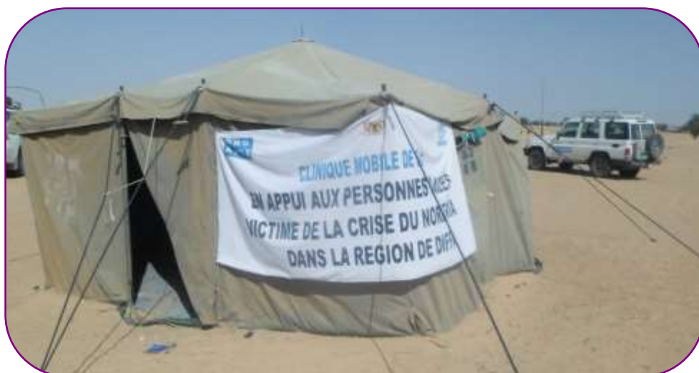
La situation à Diffa a pour conséquence un ralentissement des activités commerciales du Niger

le droit à la protection, le droit à l'éducation, le droit à la participation, le droit à un environnement sain et durable, le droit à l'alimentation et le droit à la santé.