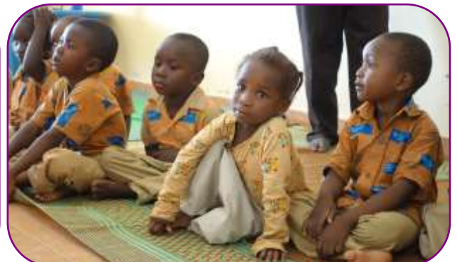
Les enfants sont très attentifs pendant les sensibilisations aux droits de l'enfant