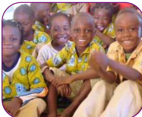
Les enfants se développent sainement