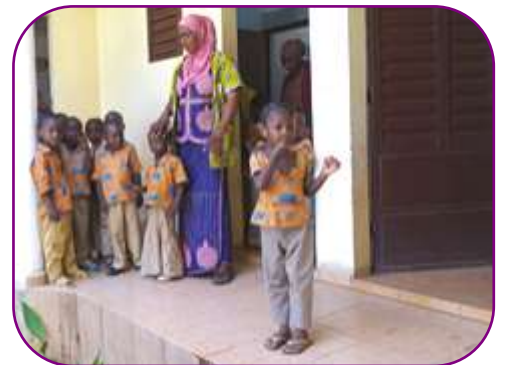
Des cours d'autodéfense sont donnés pour renforcer l'aplomb des enfants