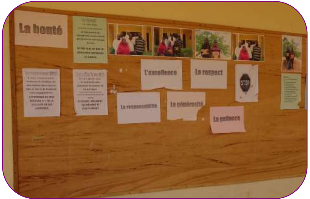
Les valeurs prônées

Une attention toute particulière a été portée aux enfants les plus faibles afin de bien les préparer à leur entrée à l'école primaire. Cela s'est concrétisé à travers un soutien individuel mais aussi des activités ludiques et sportives qui permettent aux enfants de se développer sainement.