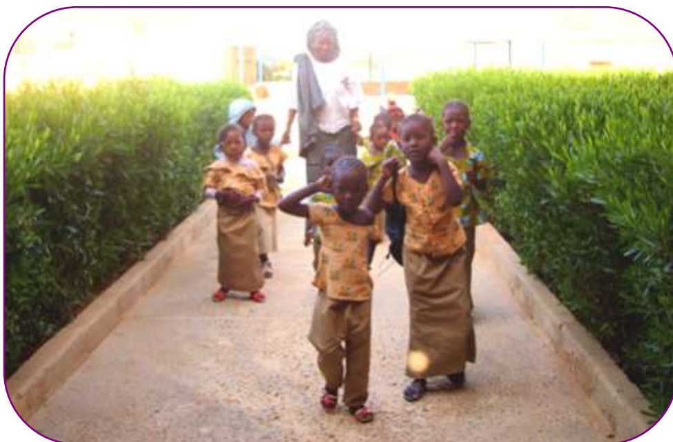
46 enfants proviennent de la communauté pauvre de Dosso

Ils ont également fait partie du CAPED (Teaching Consultancy Unit) organisé par le Conseil de Surveillance des écoles maternelles de Dosso.