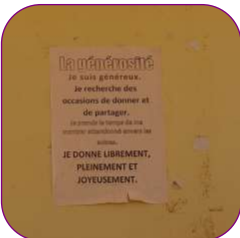
Des affiches reprennent les valeurs à apprendre et à vivre