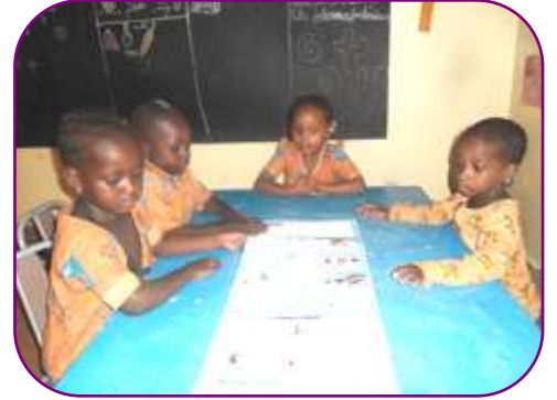
Les activités ludiques, sportives et cognitives ont fait évoluer les enfants au cours de l'année